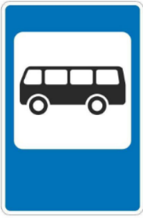
Знак остановки транспорта

Здесь останавливается общественный транспорт, это знак остановки.