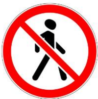
Знак движение пешехода запрещено

Это обозначение для водителей, чтобы они знали, что рядом могут быть дети. Такие знаки устанавливаются рядом со школами, детсадами, другими детскими учреждениями.