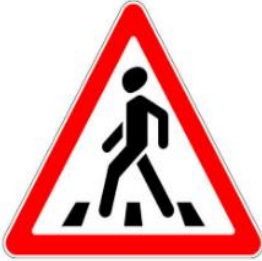
Знак перехода рядом

Где есть это обозначение, МОЖНО переходить дорогу. Это разрешающий знак.