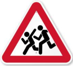
Знак дети рядом

Здесь есть подземный переход, рядом оживлённая трасса, преодолеть которую можно под землёй.