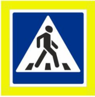
Знак пешеходного перехода

Где есть это обозначение, МОЖНО переходить дорогу. Это разрешающий знак.