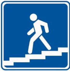
Знак подземного перехода

Знак перехода близко, но прямо здесь переходить НЕЛЬЗЯ . Поэтому треугольник красный.